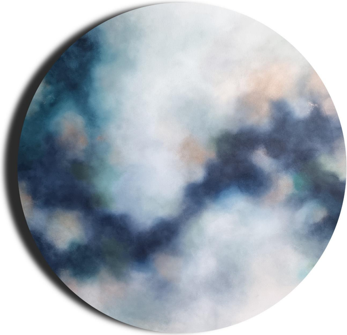
Tell me everything