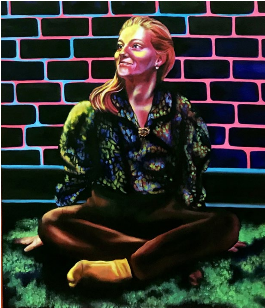
Julie Oil on canvas Laura Dauchet 2022 75 x 65 cm