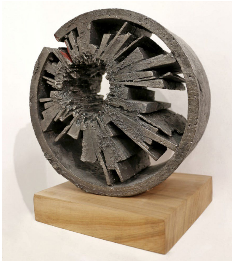
Pipe #2 Ela Urban

Cast iron & wood 2017 17 x 17 x 20,5 cm Unique piece