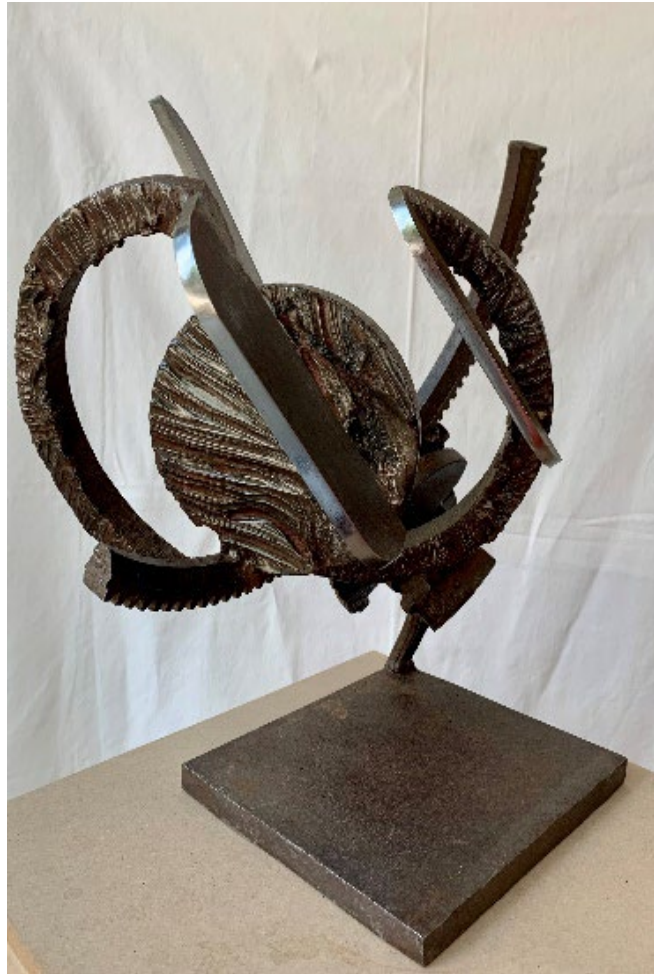
Imbalance Ela Urban