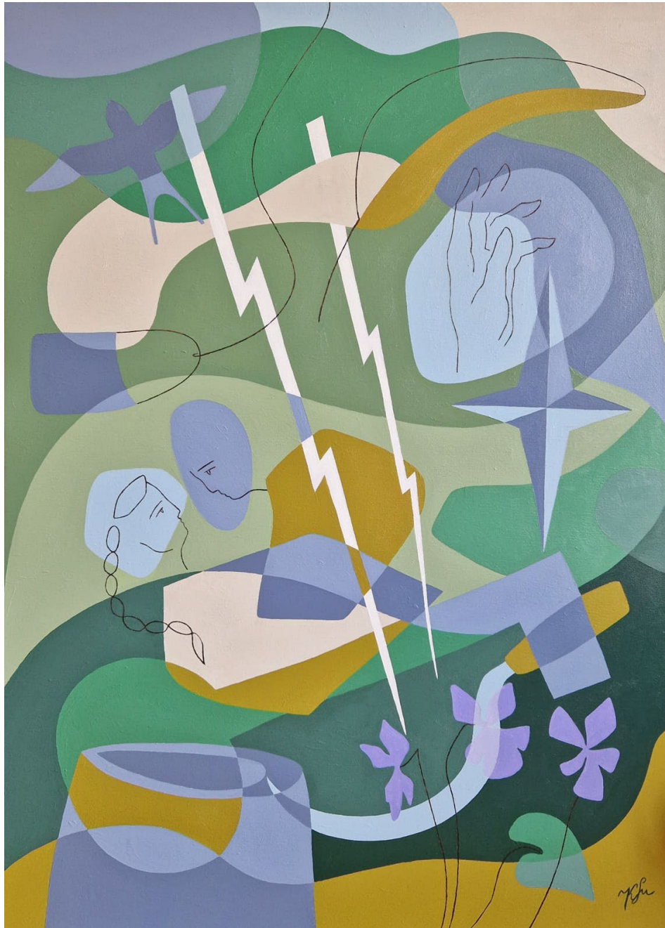
Faith and Serenity Kinga Su