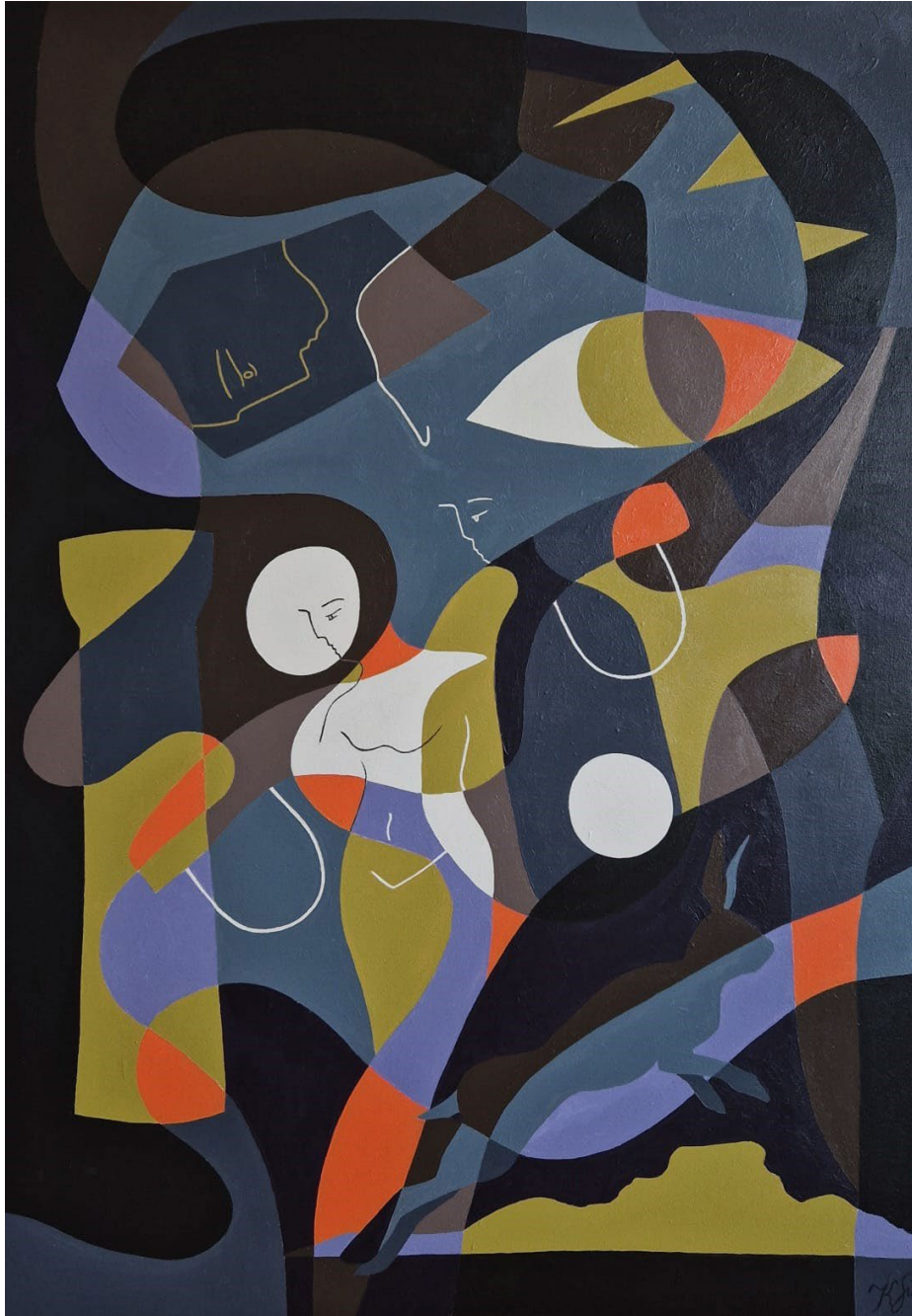
Even in the Darkness Acrylic on canvas Kinga Su 2023 100 x 70 cm