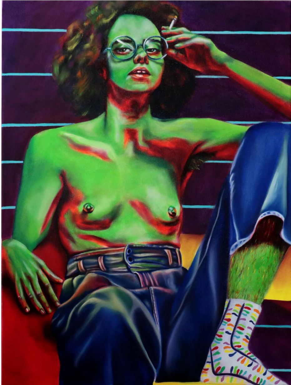
Juliette Acrylic and oil on canvas Laura Dauchet 2021 80 x 60 cm