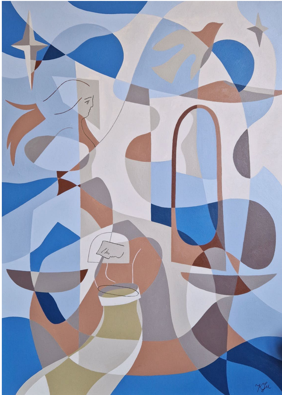
Peace in Reflection Acrylic on canvas Kinga Su 2023 100 x 70 cm