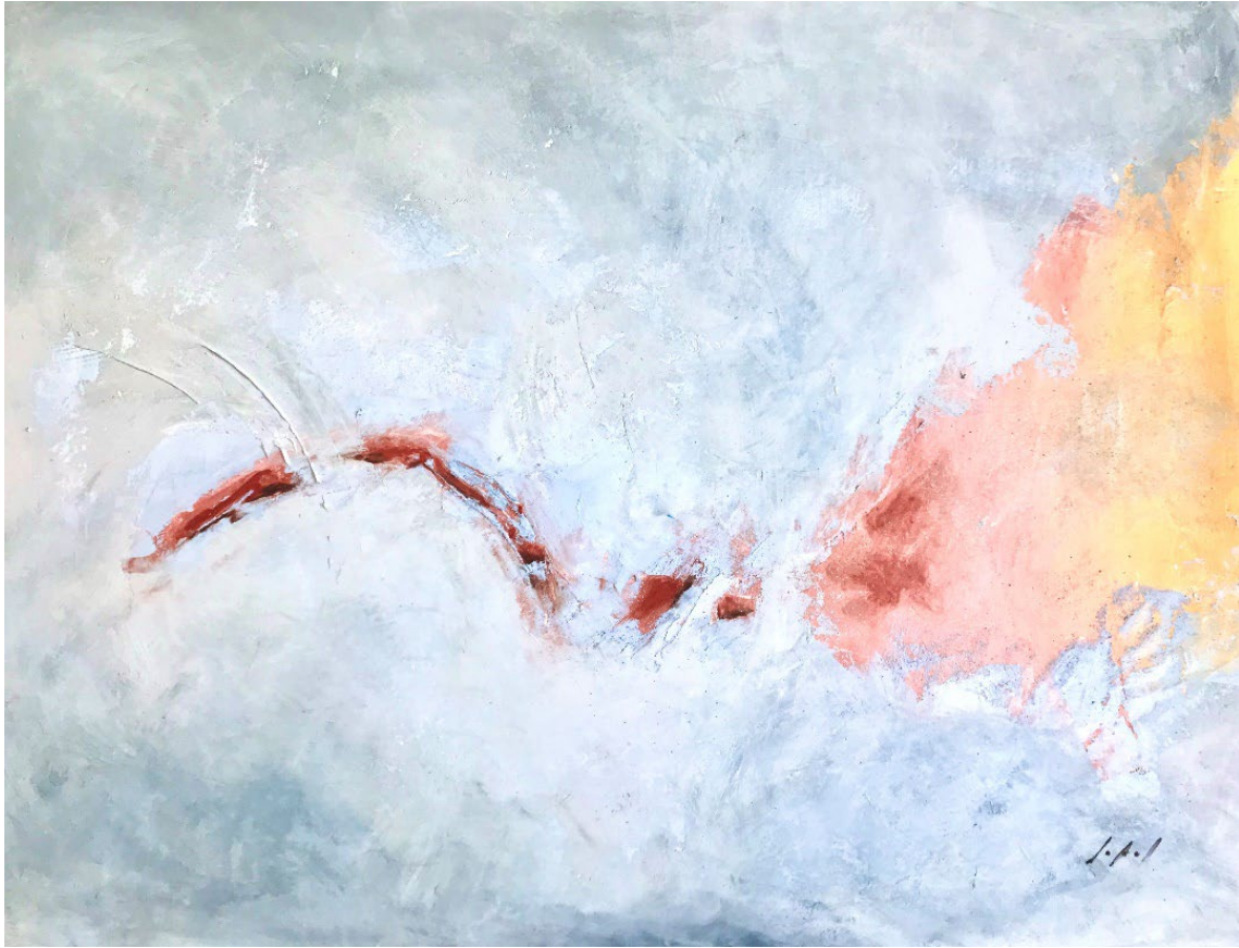
Breath Oksana Sokolova

Gesso, coated with lime, on a wooden panel 2022 120 x 90 cm