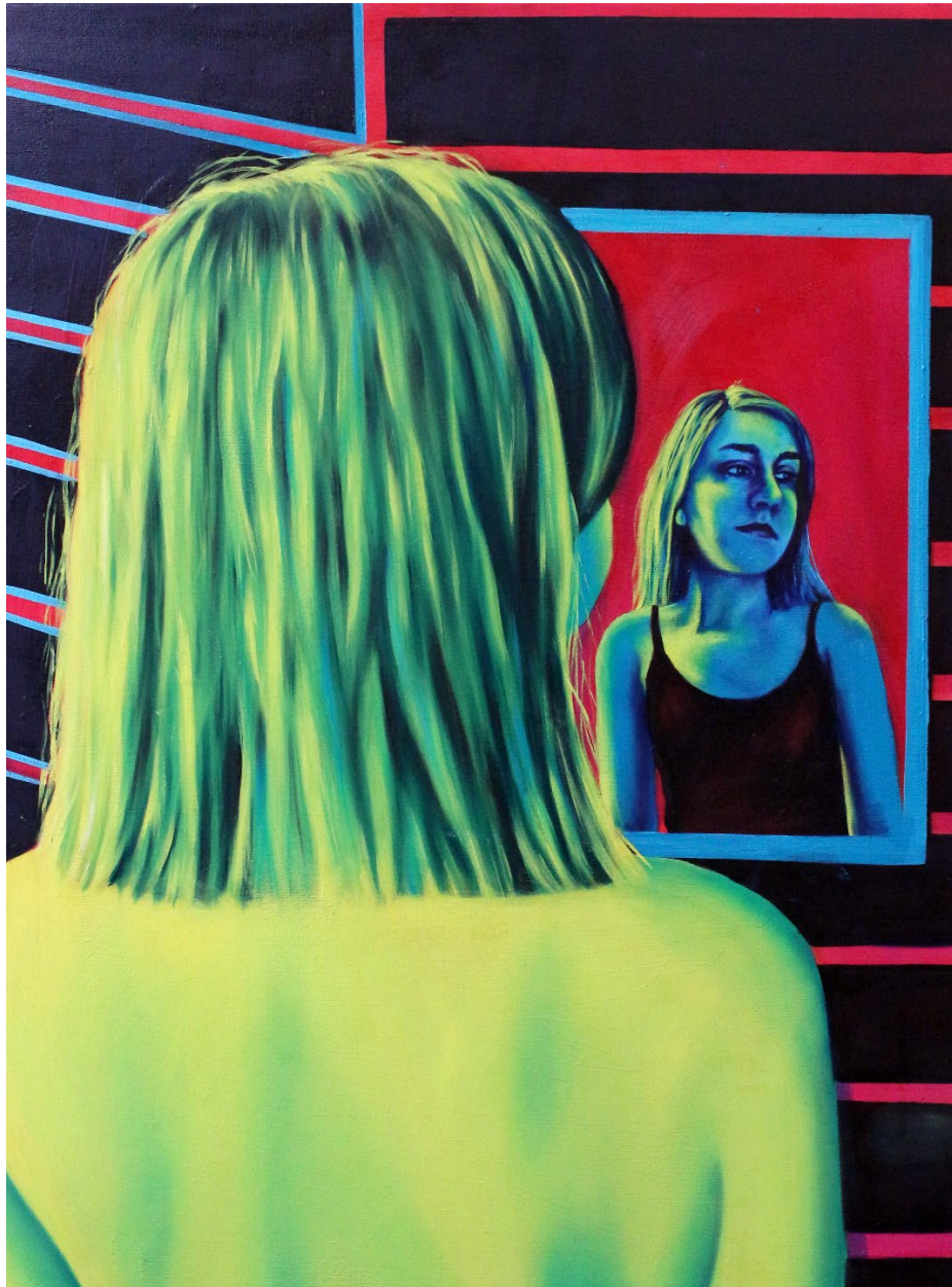
Lorraine Acrylic and oil on canvas Laura Dauchet 2021 80 x 60 cm