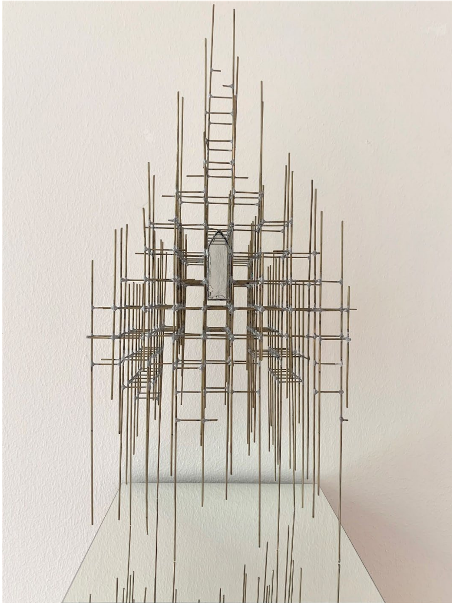
Templum (white) Brass and glass Ela Urban 2018 30 x 21 x 60 cm